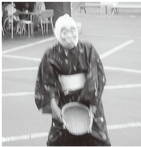
私はだれでしょう？