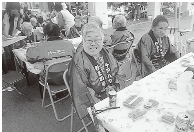
「やっぱりお祭りは楽しいね」いい笑顔ですネ。