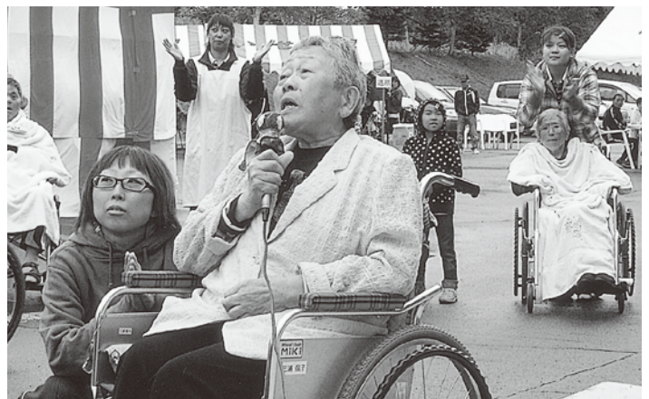
緊張したけど、上手に歌えました！