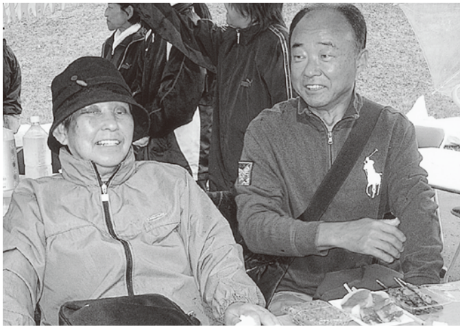
久々のおまつり、たのしかったよ！