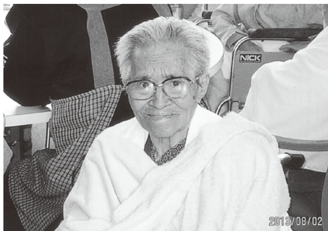
初めてのいせの里祭り。良い思い出ができたよ。