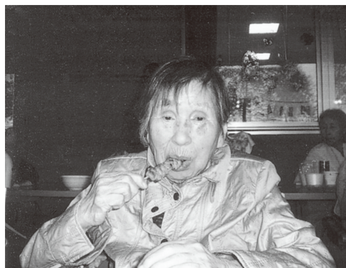
やきとりおいしいね～