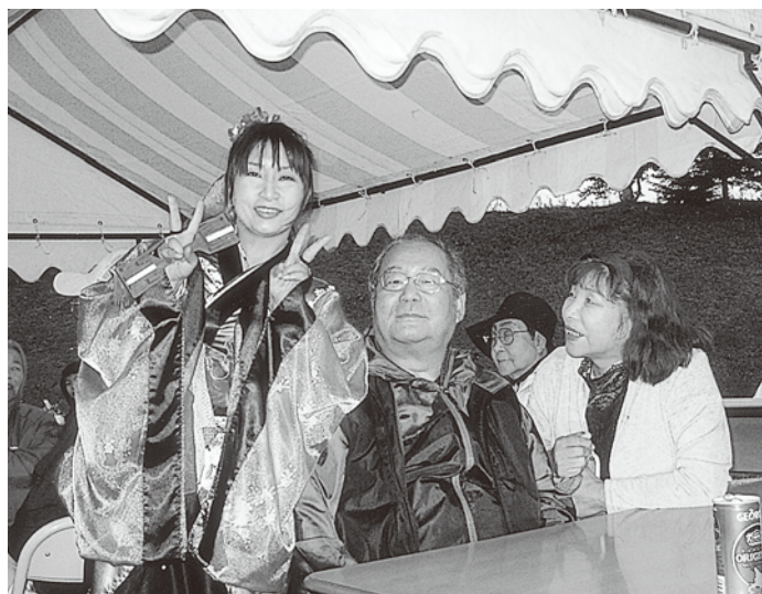
「娘のおどりはすばらしかった！！」