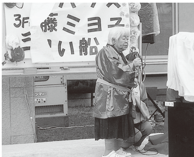
すてきな歌声で盛り上げてくれました ケアハウスの歌姫