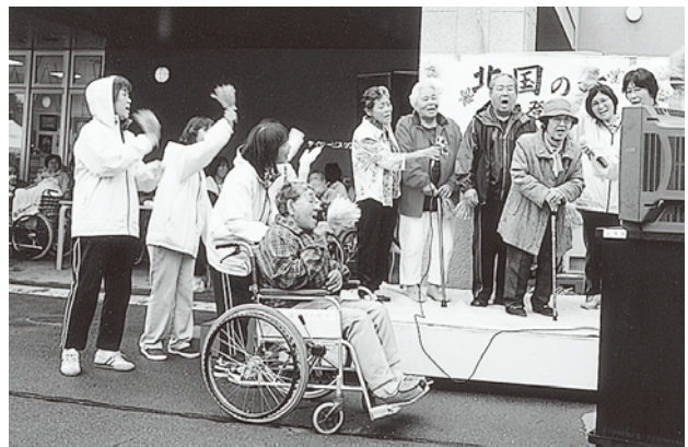
通所りハビリ混声合唱団で頑張りました！