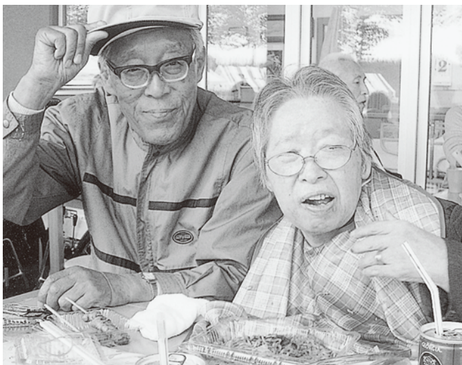
美味しいものをたくさん食べました！